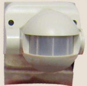
Czujnik ruchu (dostarczany wraz z lustrem).